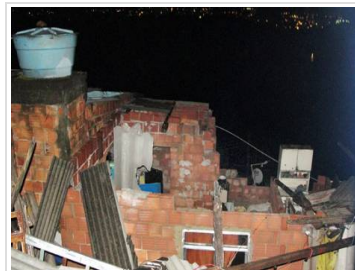
Galeria de fotos

Pouco mais de uma hora de chuva. O tempo foi o suficiente para causar danos na tarde de hoje (11). Acompanhada de ventos fortes e pedras de granizo, a chuva causou alagamentos, destelhamento de casas, quedas de árvores e galhos, e deixou bairros inteiros sem energia elétrica.